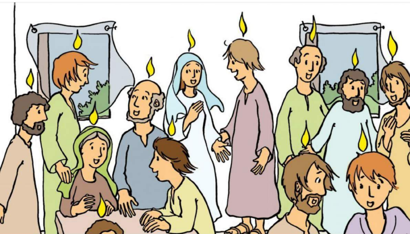
Ci-dessus : Célébration de la Pentecôte (Lundi...)