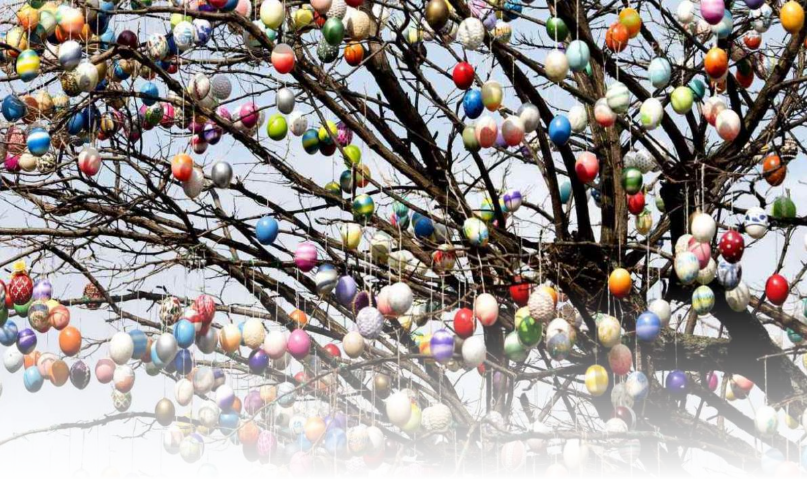
Ci-dessus : Oeuforie - célébration de Pâques